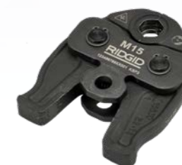
M - V 12 - 35 mm

RP 219 on kaikki 19 KN puristinleuat ja -profiilit, jotka vaihtelevat M & V-profiileista 35 mm:iin metalliliitäntöihin TH, U, G ja RF 40 mm asti muovi- ja monikerroksisissa järjestelmissä.