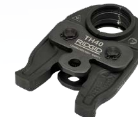
TH - U - G - RF 12 - 40 mm